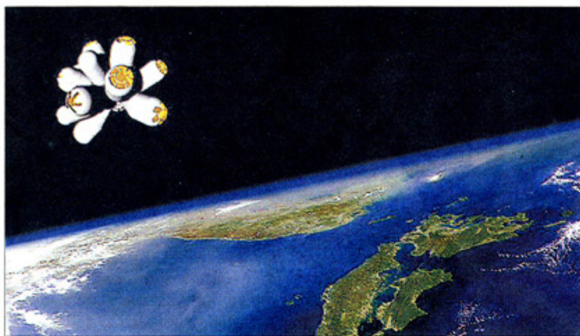
►► Imatge virtual ► L'hotel, a l'espai.

arestes i només disposen de set metres per on flotar sense gravetat. Però, ¿és factible aquesta quimera? «Pujar un hotel a l'espai en l'Ariadne 5 o en la Soiuz és factible. Cap just a la bodega de l'Ariadne. Pujar-hi el passatger ja és més complex», explica. I segons les seves previsions, almenys hi ha unes 40.000 persones amb capacitat per pagar el total de tres milions d'euros que costa dormir entre galàxies.